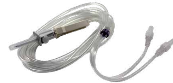
Schlauchset Tubing set Set de tuyau Conjunto de manguera Set manichetta

The special, two-sided irrigated forceps with Luer-Lock connector allow for an even more targeted, simultaneous and thus more effective irrigation of both forceps tips for particularly critical applications.